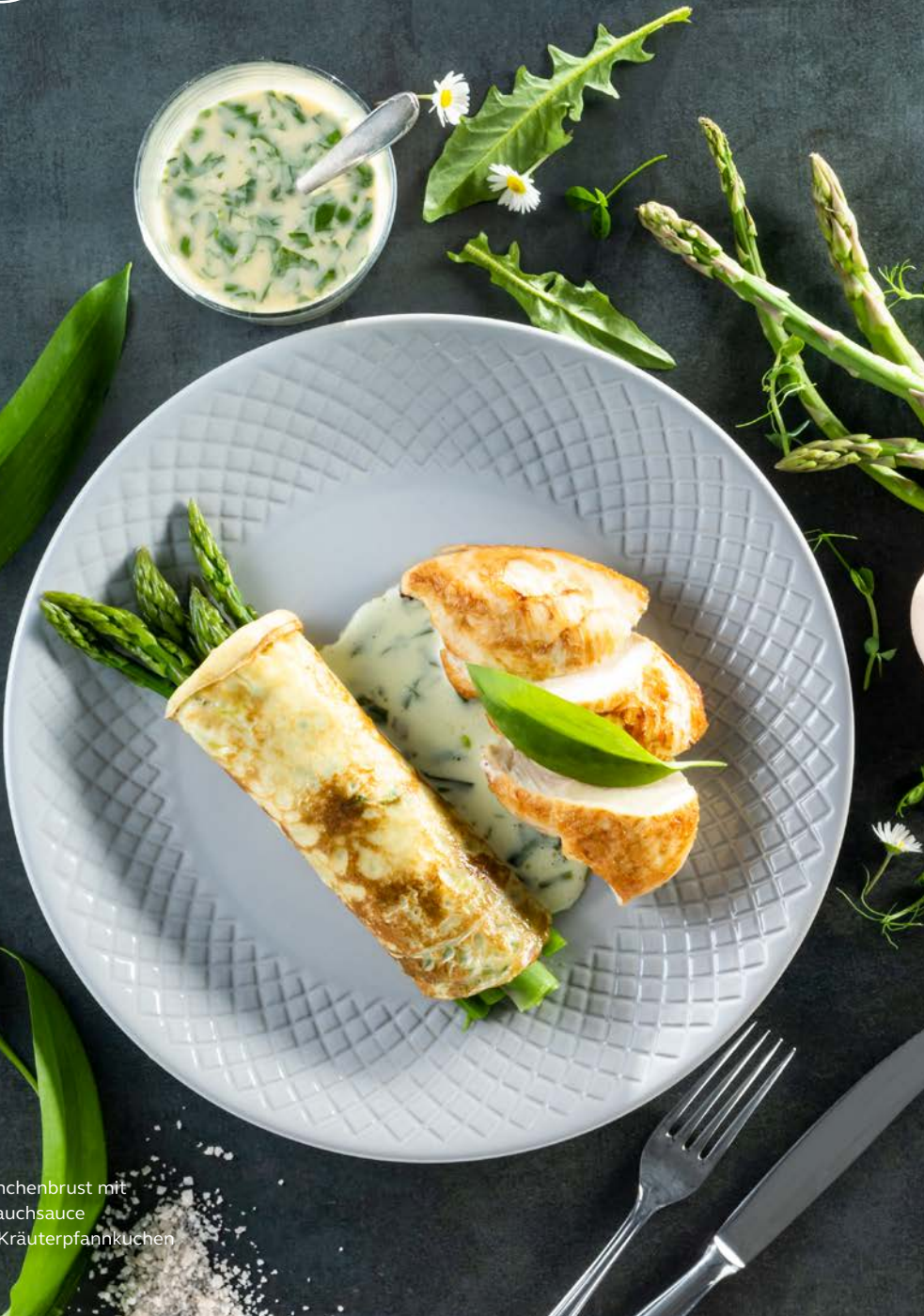
Hähnchenbrust mit Bärlauchsauce und Kräuterpfannkuchen

Zusätzliche Belohnung wartet auf Genießer:innen, denn auf den Speisekarten der KräuterWochen befindet sich ein QR-Code zum Gewinnspiel.