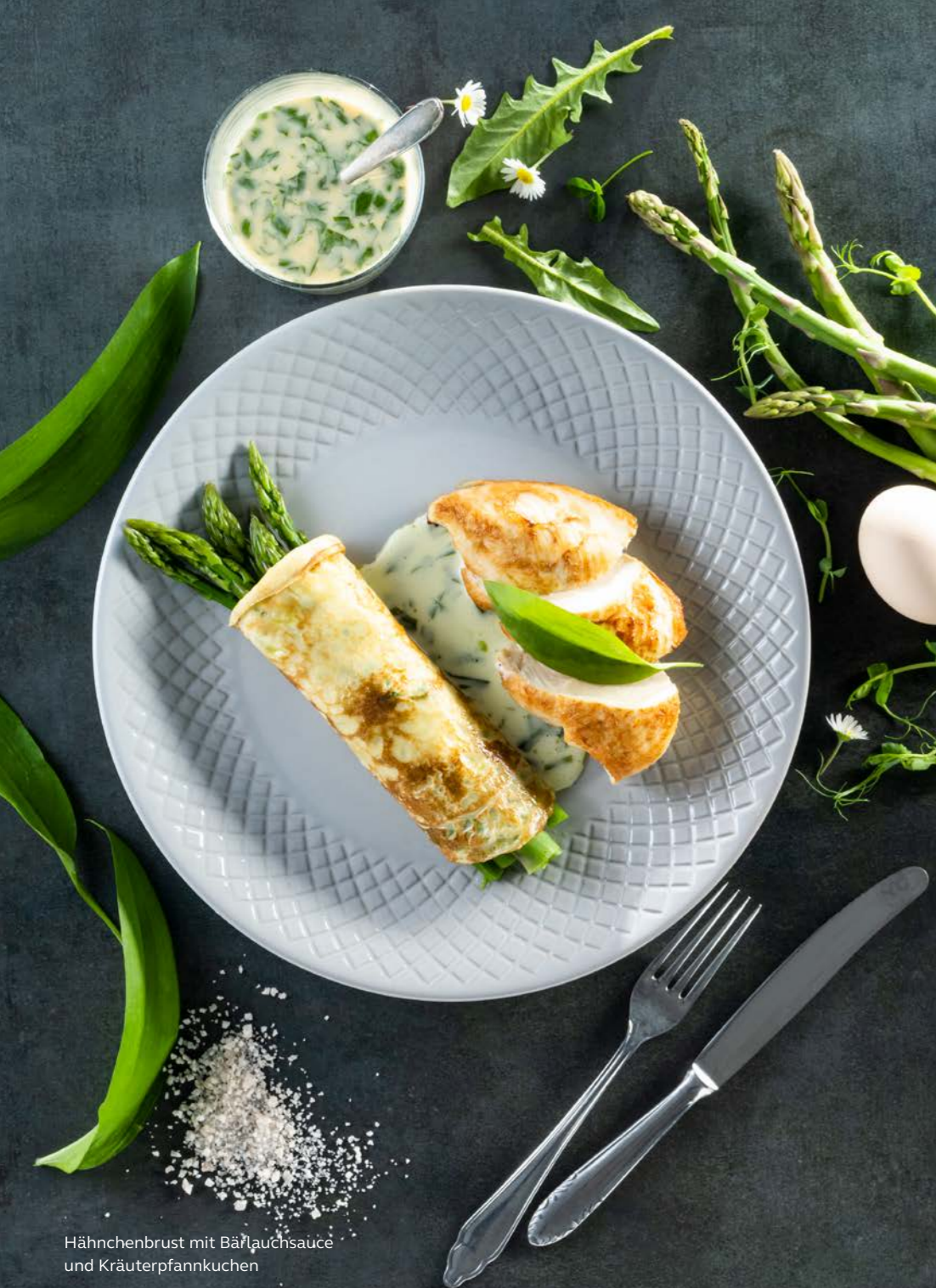
Hähnchenbrust mit Bärlauchsauce und Kräuterpfannkuchen

Weitere Infos zu den KräuterWochen & eine Übersicht der regionalen Angebote: bodenseewest.eu/kraeuterwochen